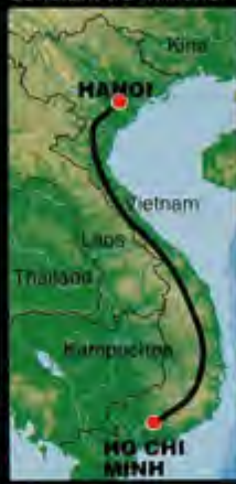
PÅ LANGS: De norske 68-erne syklet Vietnamkrigen på langs.