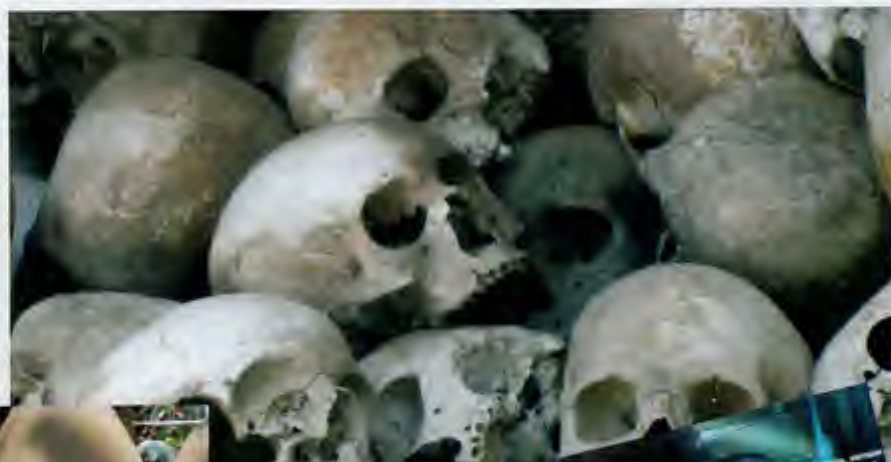
FÆL PÅMINNELSE: En haug hodeskaller er en fæl påminnelse om en krig alle vil glemme.