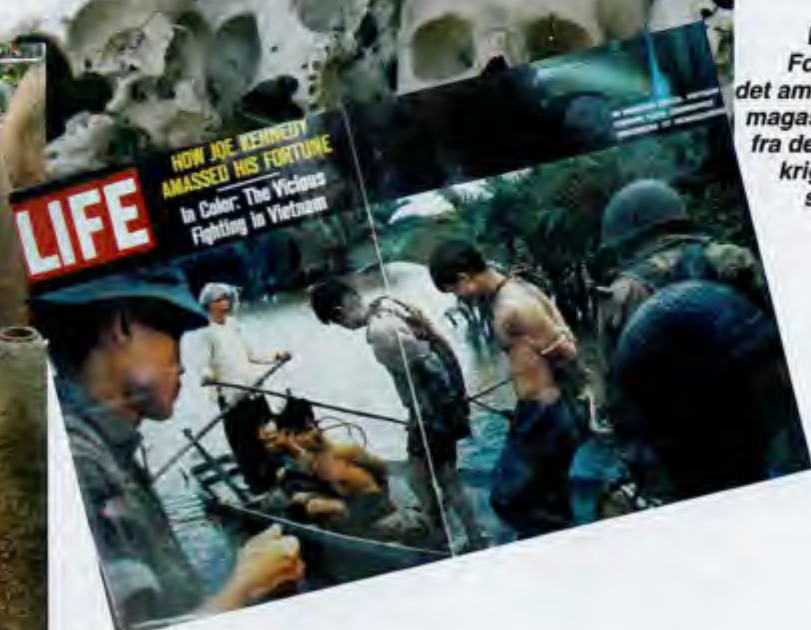
KRIGEN: Forsiden på det amerikanske magasinet LIFE fra den gangen krigen herjet som verst.