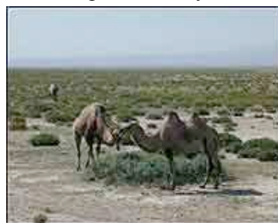
KAMELER I VEIKANTEN: Vi kunne godt ha tenkt oss å ha kamelenes evne til å holde egen vannforsyning i mange varme døgn.

Etter frokost bar turen videre mot Dulan. Et helvetes mareritt! Etter et par mil med asfalt fikk vi 100 km med dårlig annleggsvei. Temperaturen steg