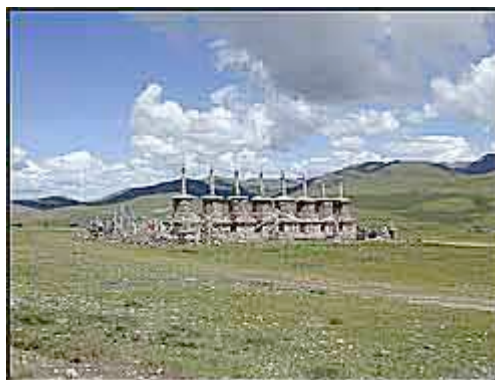
MONUMENTALT: De 8 pagodene symboliserer de 8 fasene i Buddhas liv.

Det har vært tre harde sykkeldager. Mange har stresset for å gjennomføre fullt ut, endel