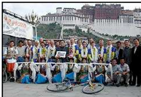
Syklingen var over. Vi hadde greid det, noen fullstendig, andre med litt hjelp av følgebussen. Men alle følte vi oss som et felles team og seieren var kollektiv. Vi er den første gruppen som på 14 dager har syklet fra Xining til Lhasa, i alt cirka 2000 kilometer, mesteparten av tiden i en høyde på over 4500m.

Hotellet burde vært et bra utgangspunkt, der det var bygget oppå noen varme kilder med bad. Men alt var skitt og palmene av plast.