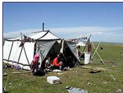
NOMADELEIR: På toppen av fjellet besøkte vi en fargerik nomadeleir.

Mange birøktere langs veien i dag. Vi kjøpte honning som var et kjærkommet tilskudd til kosten.