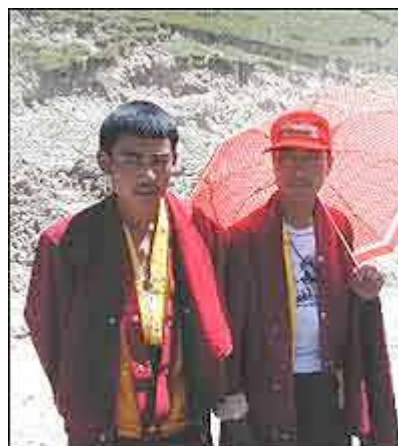
MUNKER: Munkene vi møtte var åpne og smilende og tittet på jentene med nysgjerrige blikk.

Munkeguttene så rene ut og smilte åpent. De var ved en anledning tydelig interessert i Annys pupper som akkurat da holdt på å sprette ut av en for oppkneppet sykkeltrøye.