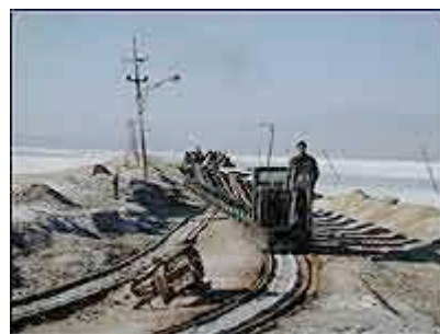
SALTTRANSPORT: Saltet transporteres fra sjøen til depoet. Vognene lastes opp for hånd. Her er nattskiftet på vei hjem. Foto: 0

Før vi spiste frokost syklet vi ned til Chaka Salt Lake, Kina's største saltforekomst. En sjø som kan forsyne Kinas befolkning med salt i 90 år. Til tross for at det heter lake er det