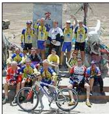
Glade gutter på himmelens tak.

Etter noen dager med heller ensformig og het ørken-sykling beveget sykkelrytterne seg nå i medvind og i mer medgjørlig temperatur, selvom det skaper problemer at luften er relativt kald mens sola er het.