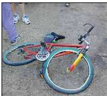
Denne sykkelen krever nok litt mekking før den er klar til bruk igjen.

Vi ble også angrepet av løshunder. Bitt i leggene er en alvorlig sak pga. Rabies muligheten. Men følgebussen handlet raskt og fikk svingt mellom og lå på hornet.