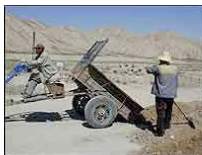
BYGGER VEI: De typiske redskapene for en kinesisk anleggsarbeider er handtraktor og spade.

Vi fikk oppleve kinesisk veibygging på nært hold. Typisk eksempel på kinamodellen; mange mennesker med få, enkle oppgaver. Alle oppgavene er like viktige. Vi ble