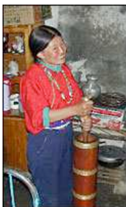
KUNNING AV YAK-SMØR: Her ser vi den eldste av søstrene kinne yak-smør til teen.

Etter en hviledag hadde vi en etappe på 150 km foran oss. Dette var en endring på programmet som vi valgte å gå for fordi etappen skulle være lett, og da skulle vi komme fram til Wenquan med sine varme kilder.